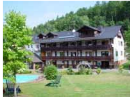
zur Bamberger Mühle