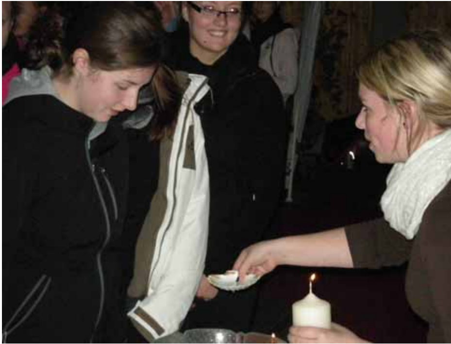
Dem feuchten Element gemäß wird das Taufwasser mit einer Muschel geschöpft