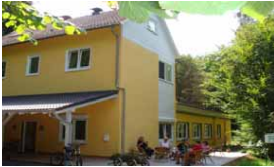
vom "Kaffee Böhnchen"

Text / Foto / Regie: Birgit Tintjer, geb. Klein / Gym / Lucidi