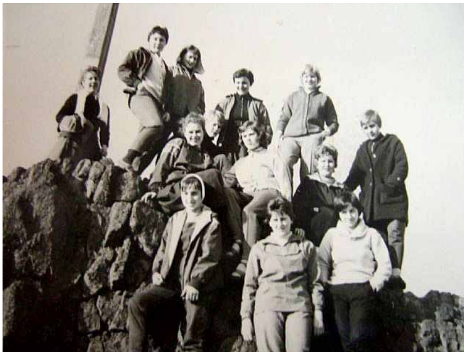
1958 - die Hagebutten auf dem Wachtkuppel