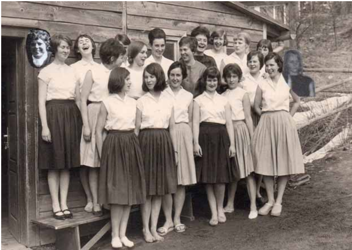
1962 - die Fichten vor dem Gymnastiksaal in Schwarzerden

Gesucht werden die Adressen der abgebildeten "Fichten" Examen März 1962