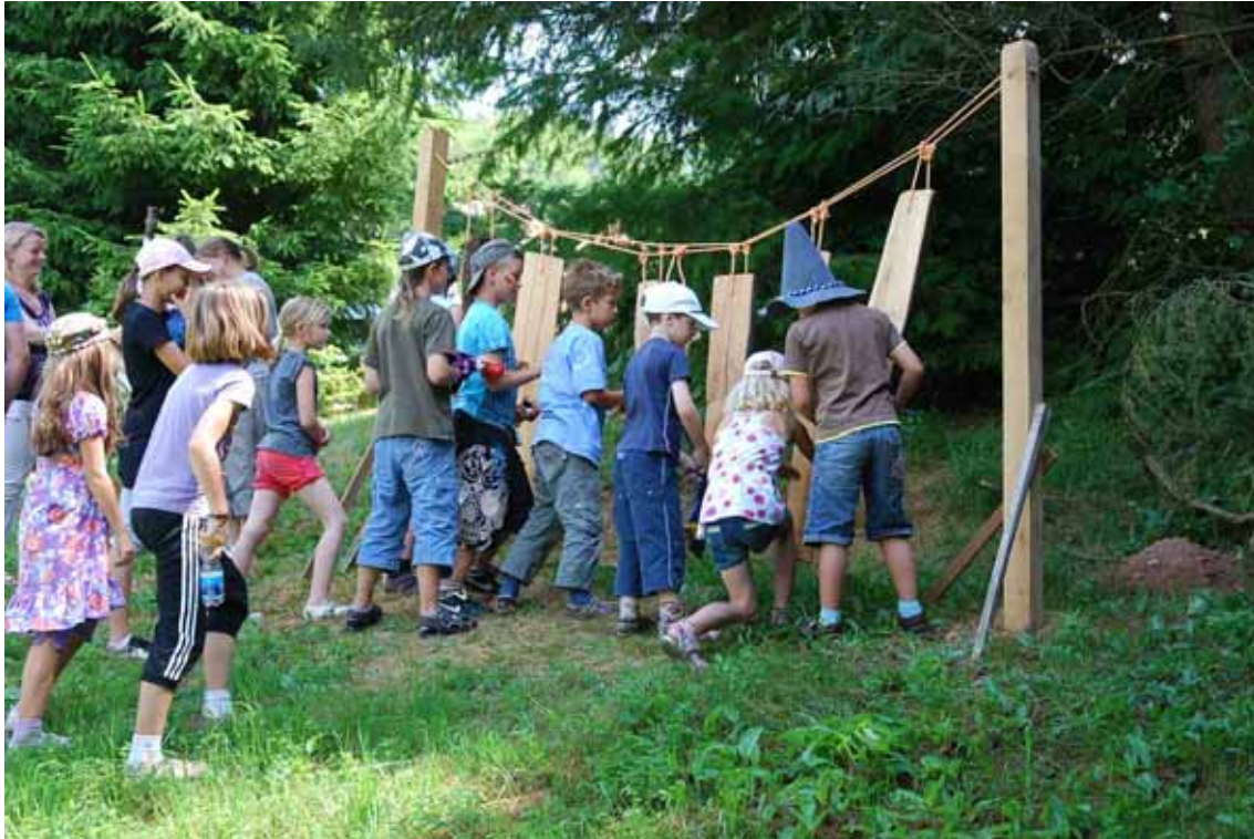
AT-Projekt 2010: Die Quellenkinder erproben das Baumxylophon